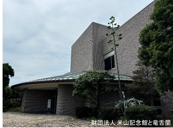
財団法人 米山記念館と竜舌蘭