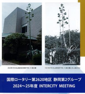
国際ロータリー第2620地区 静岡第2グループ 2024~25年度 INTERCITY MEETING